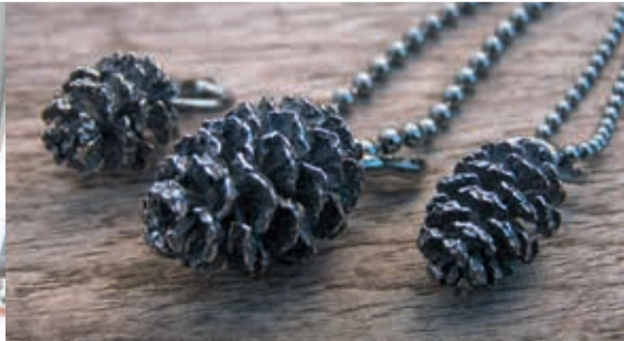
Nynne Kegel • Smykker