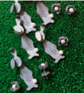
Dorte Lausten • Smykker