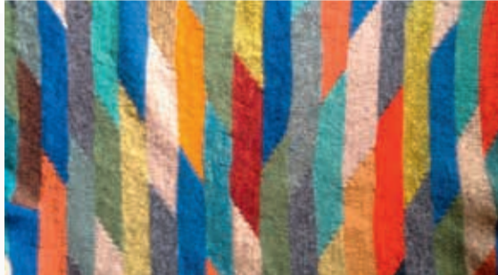
Kirsten Blichert • Tekstil