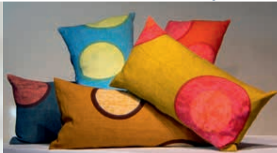
Birgitte Tolnov • Tekstil