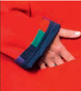
Lise Møller • Tekstil