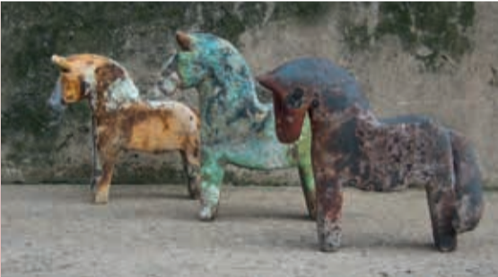
Trine Toft • Keramik