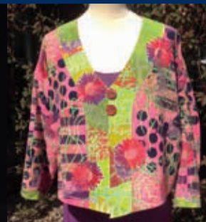
Annalise Overgård • Tekstil