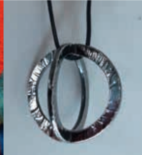
Grethe Refsgaard • Smykker