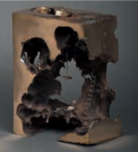
Morten Lykke • Skulptur