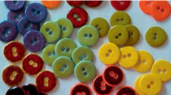
Birthe Sahl • Knapper