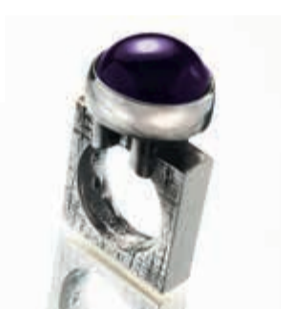
Jytte Lyhne • Smykker