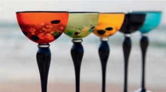
Rikke Precht • Glas