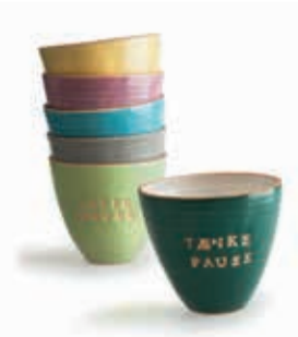
Trine Bruun • Keramik